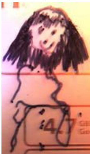
5.4.1.Рс. Рисунок 3

Таким образом, задачей ОЮФМ, а точнее, его микросоциального воплощения КМЮФМ, будет сохранение всего рода по материнской линии. Задачи рода будут иметь для КМЮФМ и ОЮФМ значительно более высокий приоритет, нежели интересы отдельной личности - собственного хозяина, но подробнее об этом позже. Таким образом, если посмотреть на мир отношений сквозь призму ЮФМ – соединений, то мы увидим единое облако, окутывающее собой всю родню по женской линии, и тонкими нитями связанное через ФП брачных партнеров с другими КмЮФМ родами.