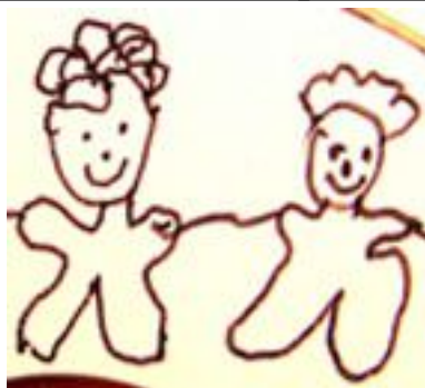
5.4.1.Рд. Рисунок 4

Как я уже упоминал, положение вещей меняется кардинальным образом, лишь, с наступлением у женщины репродукции, и ее собственный АЮФМ получает право управлять остальными не репродуктивными родственницами и родственниками в своих репродуктивных интересах.